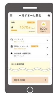
「へるすまーと泉北」イメージ

体力測定データ、自宅でのトレーニング課題、健康体操動画の視聴、1日の歩数、体重、血圧等バイタルデータ ※歩数やトレーニング実績をポイント化し、獲得ポイント数を競います。