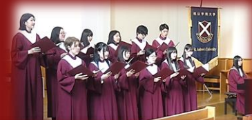
桃山学院大学 チャペル附属聖歌隊

1990年チャペルにパイプオルガンが設置された翌春から桃山学院大学オルガニスト、その後、活水学院オルガニスト・活水女子大学音楽学部助教授、姫路パルナソスホールオルガニスト、中学校音楽科教員を経て、2020年4月から桃山学院大学オルガニスト。パイプオルガンの保守管理、学院の式典催事・礼拝諸式での奏楽、チャペル附属聖歌隊の伴奏、在学生対象のオルガン講習等に当たっている。