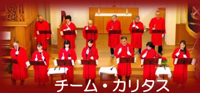
チーム・カリタス

1990年チャペル完成より活動を開始し、キリスト教センター所属の学生団体として、キリスト教理念に基づき、歌を通しての奉仕活動を行っている。主に、大学の諸行事や礼拝、チャペルで行われる結婚式などで聖歌・アンセムを奉唱するほか、地域のイベントなど学外での活動にも積極的に参加し、大学祭では聖歌隊独自でチャペルコンサートを企画し開催している。