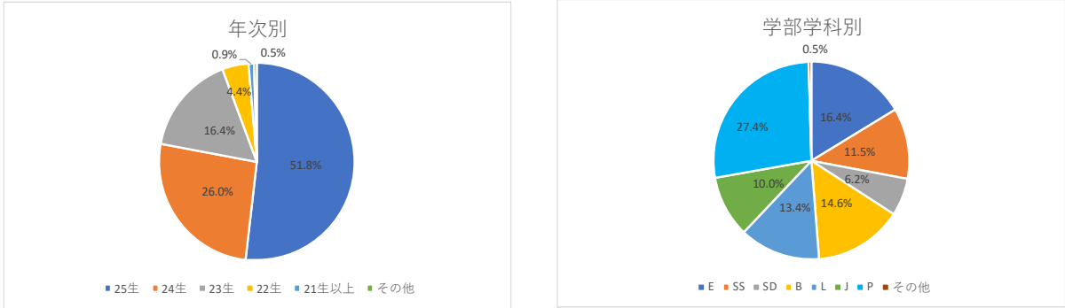
□アンケート対象科目受講者割合