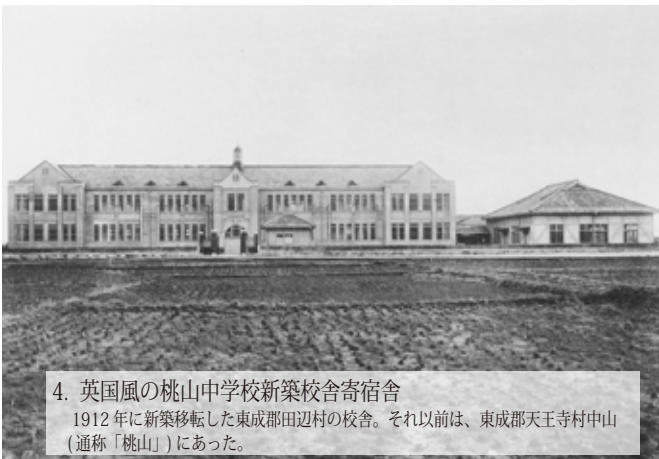
4. 英国風の桃山中学校新築校舎寄宿舍 1912 年に新築移転した東成郡田辺村の校舎。それ以前は、東成郡天王寺村中山 (通称「桃山」) にあった。