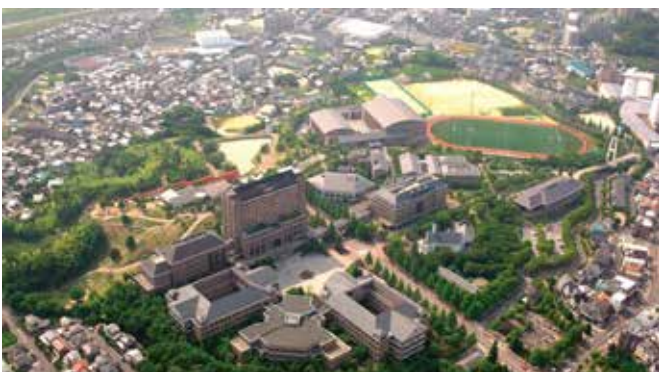
5. 現在の桃山学院大学 1971 年に、堺市登美丘 (現在の東区西野) に学舎統合。さらに 1995 年に全面移転した。

2013 年 7 月 1 日、泉大津市と桃山学院大学は、地域の発展とその基盤となる人材育成に寄与することを目的に、多様な分野での包括連携協定を締結いたしました。本展は、その連携協定にもとづいた事業の一環として開催するものです。包括的な連携を行うためには、お互いを知ることが必要となります。そこで、桃山学院大学の歴史と文化を、泉大津市民の皆さまに知っていただくために企画いたしました。