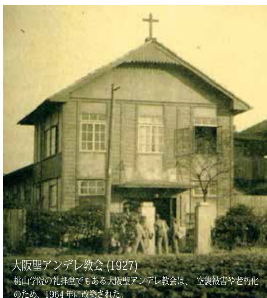
大阪聖アンデレ教会(1927) 桃山学院の礼拝堂でもある大阪聖アンデレ教会は、空襲被害や老朽化のため、1964年に改築された。