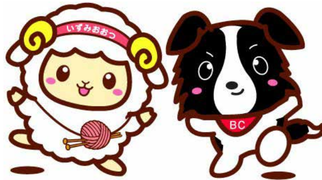
泉大津市マスコットキャラクター おづみんと ななまる