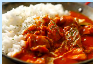
本場スパイスカレー