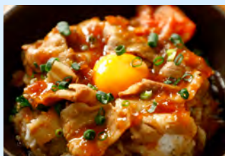
鉄鍋肉スタミナ丼