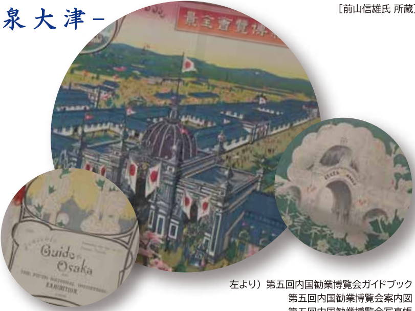
左より) 第五回内国勸業博覧会ガイドブック 第五回内国勸業博覧会案内図 第五回内国勸業博覧会写真帳 [織編館 所蔵]

第一会場 10月25日(水)～12月15日(金) 会場 桃山学院大学 聖ペテロ館2階 学院史料展示コーナー 問合せ: ☎594-1198 大阪府和泉市まなび野1-1 桃山学院史料室 TEL: 0725-92-7014(直通) / fax: 0725-54-3294 mail: archives@andrew.ac.jp