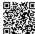
ビジネスデザイン学部へ潜入調査！！