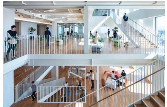
（会場となる、あべのBDL）