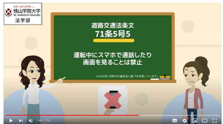
アニメ動画のイメージ（キャプチャ）